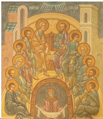
Fresque de la chapelle du Séminaire