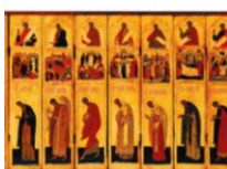
Le Sens des icônes