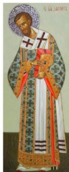
LA DIVINE LITURGIE DE SAINT JEAN CHRYSOSTOME

LIVRET NUMÉRIQUE COMBINÉ DU PROPRE ET DU COMMUN de la DIVINE LITURGIE DE SAINT JEAN CHRYSOSTOME