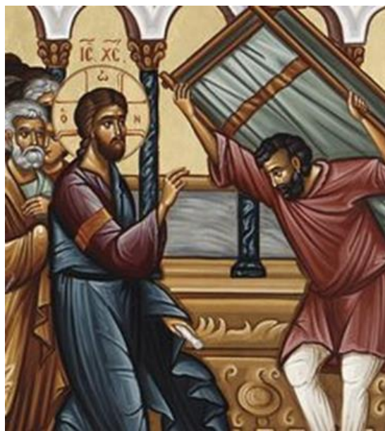
Guérison d'un paralytique à la piscine de Bethzatha le jour du sabbat. (Jn 5, 1-15)

Ce livret du propre des Vêpres est le complément hebdomadaire du Livret des VÊPRES DOMINICALES qui contient le commun des célébrations.