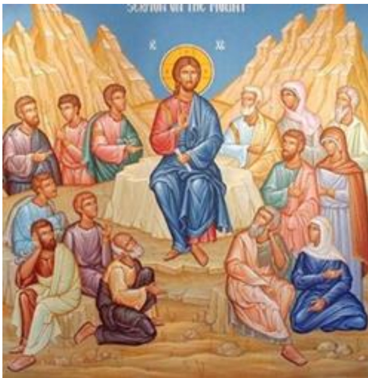
L'amour des ennemis – Lc 6, 31-36

LIVRET À EMPORTER POUR LIRE ET MÉDITER LES TEXTES CHEZ SOI.