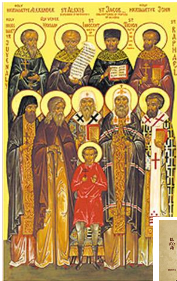
Saints de l'Amérique du Nord