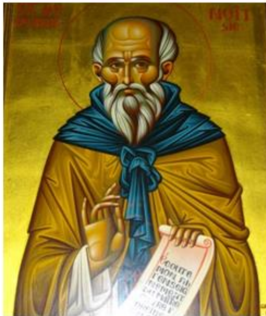
SAINT BENOÎT DE NURSIE

DIVINES LITURGIES SAINT JEAN CHRYSOSTOME SAINT BASILE LE GRAND SUIVIES DE PRIÈRES D'ACTION DE GRÂCE APRÈS LA COMMUNION